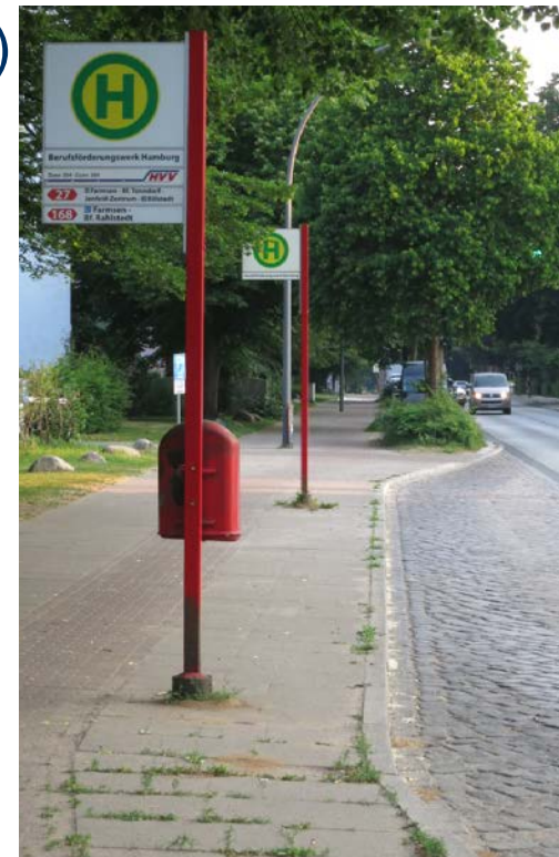
Haltestellen barrierefrei gestalten